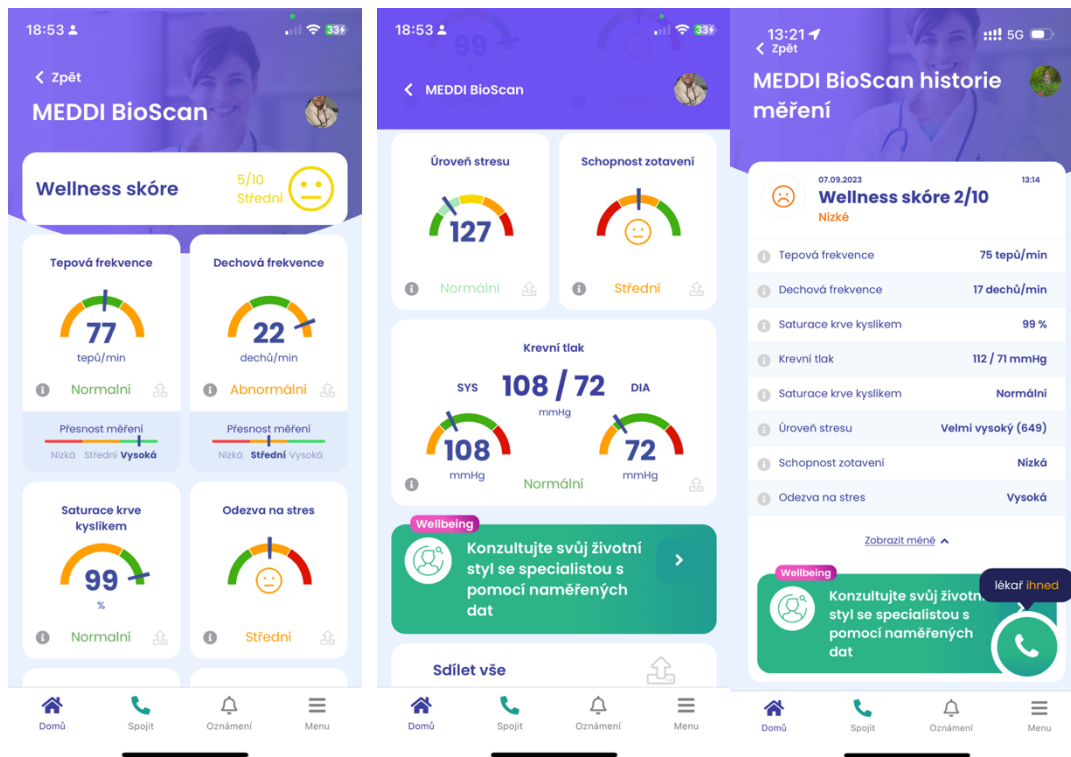
Obr.: Zobrazení souhrnu dat měření MEDDI BioScan