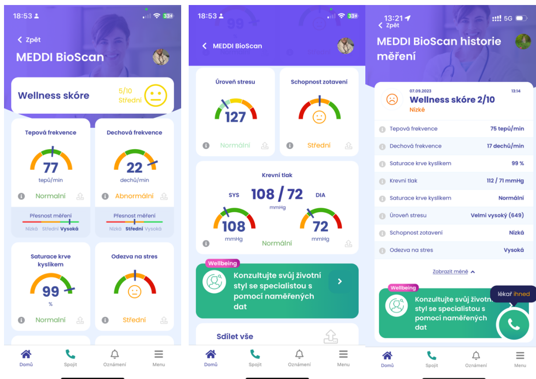
Obr.: Zobrazení souhrnu dat měření MEDDI BioScan